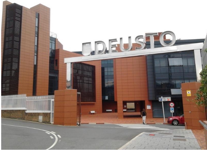
Eingang zu der Deusto Universität