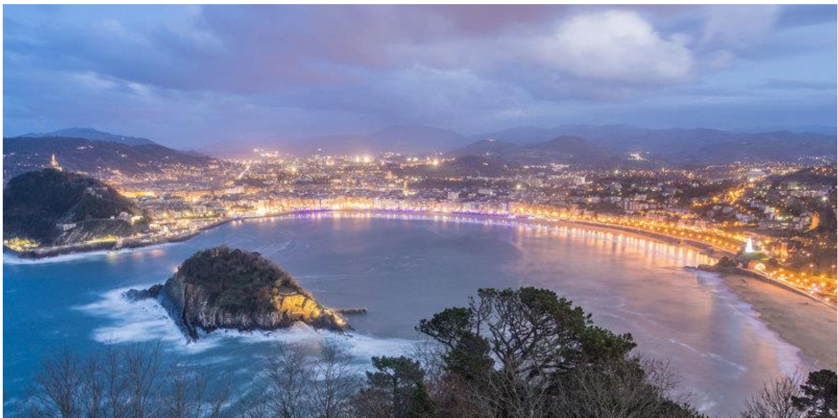
(Ausblick auf San Sebastian von Monte Igeldo)

Hiermit erkläre ich mein Einverständnis zur Verwendung meiner Fotos aus dem Erfahrungsbericht für den „International Office FK14 Bilderpool“ und damit für die Nutzung auf der Website und Print-Materialien unter Nennung meines Namens als Urheber.