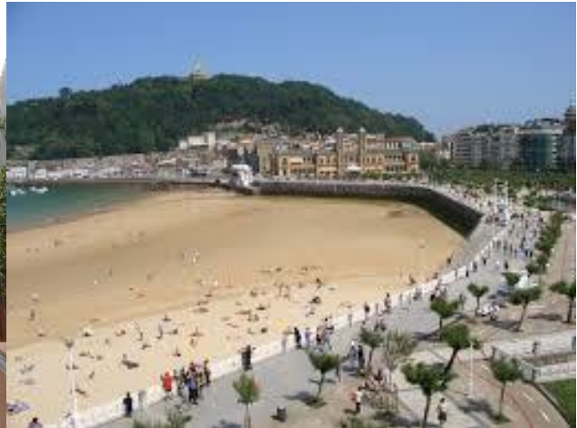
La Concha und Monte Urgull im Hintergrund