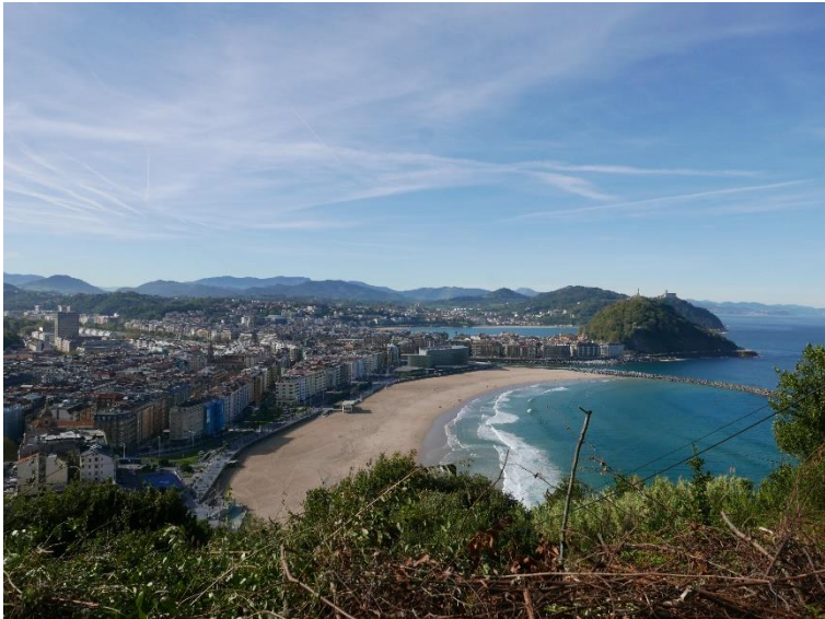
Ausblick auf Zurriola vom Camino de Santiago