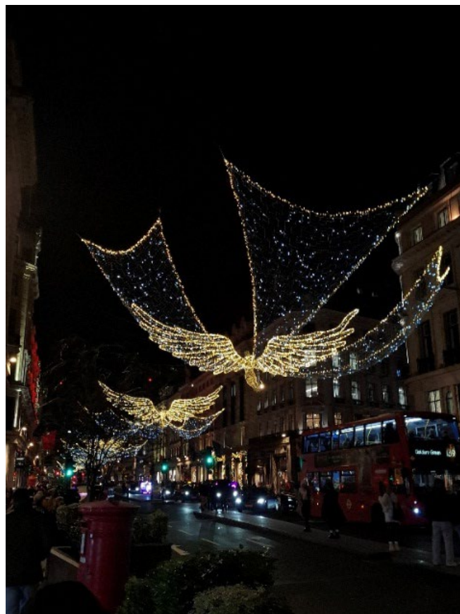
Weihnachtszeit in London