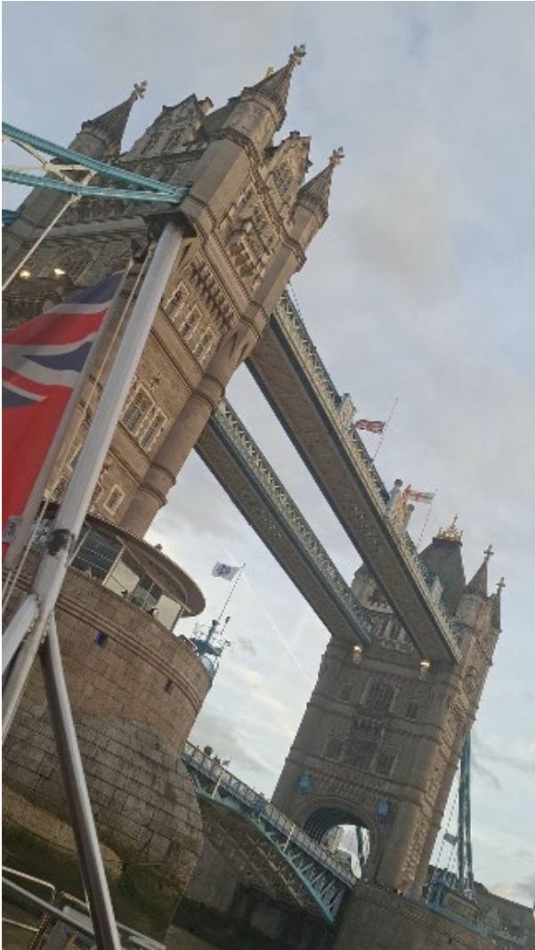
Tower Bridge vom Uber Boat aus