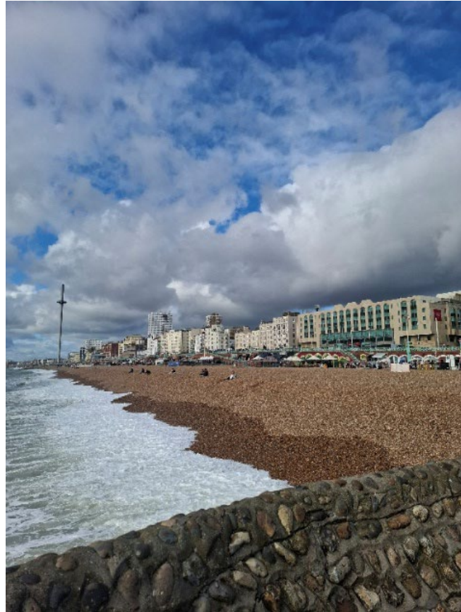
Küste in Brighton