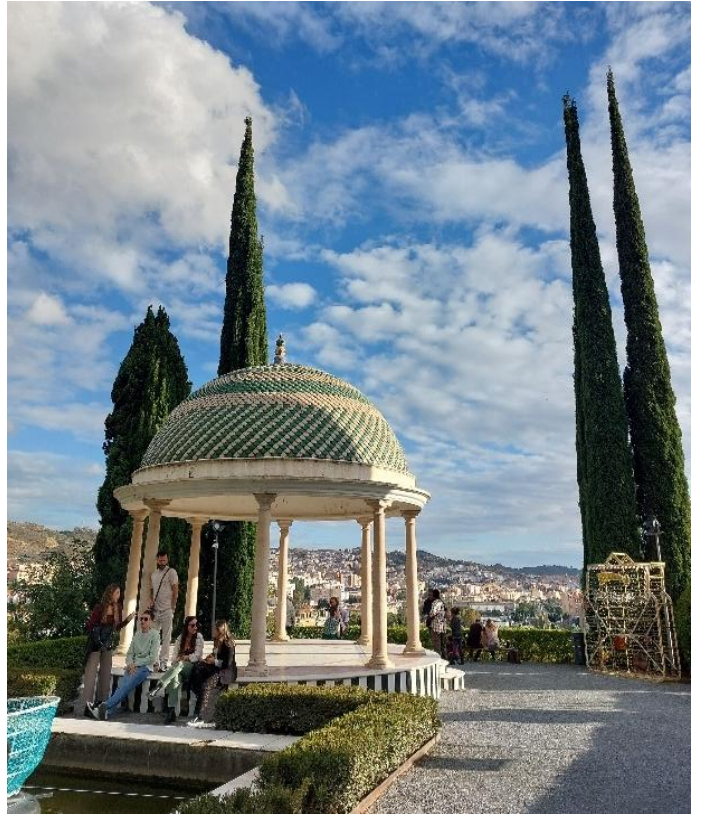
Botanischer Garten in Málaga