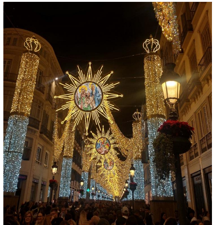
Weihnachtsbeleuchtung im Zentrum Málagas