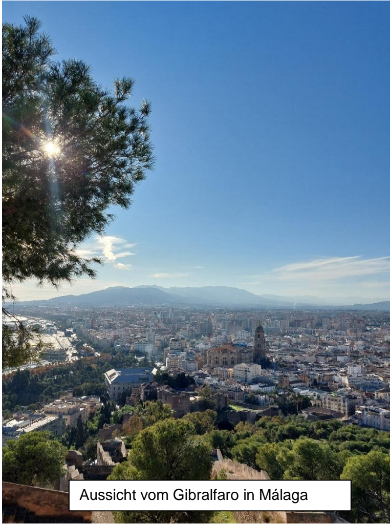
Aussicht vom Gibralfaro in Málaga