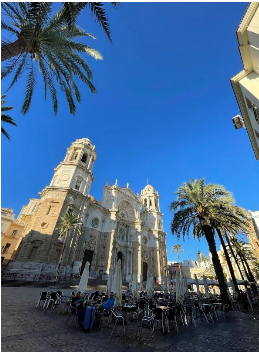
Kathedrale – Wahrzeichen von Cádiz