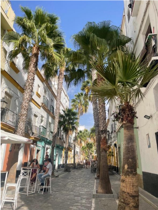
Calle Virgen de la Palma