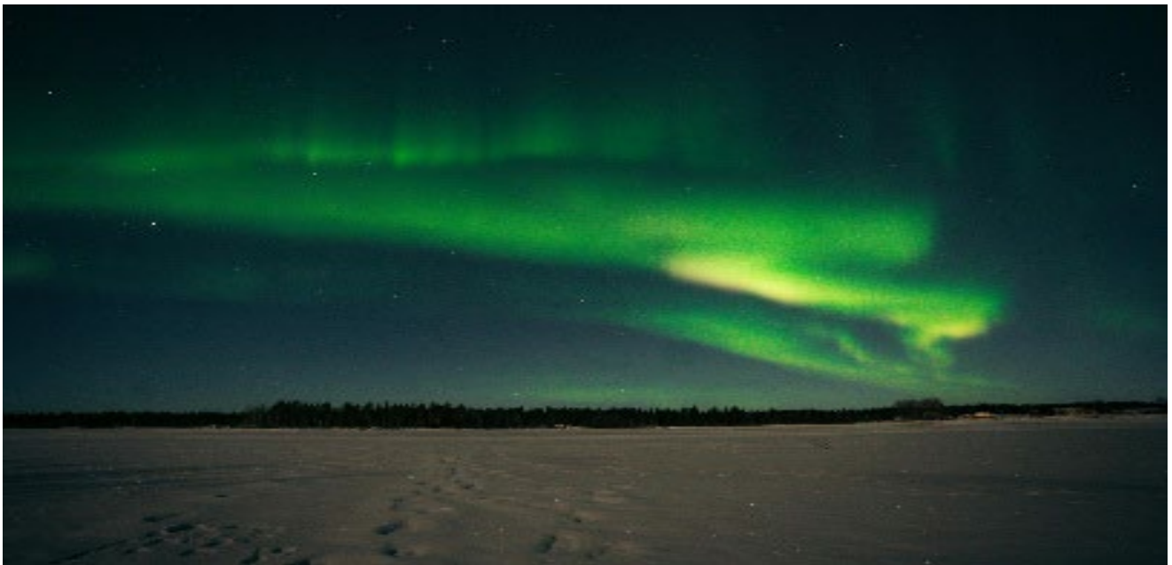
Nordlichter (Lapland auf einem gefrorenen See)