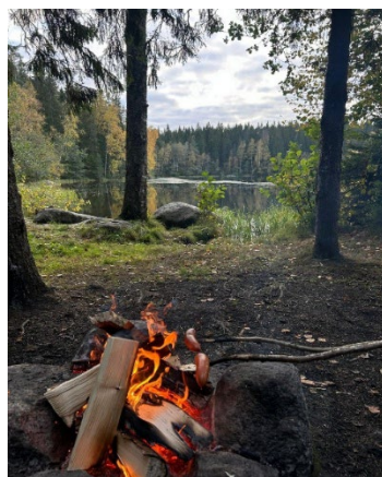
Grillplatz Ladun Maja