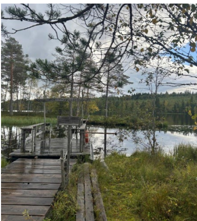
Jyväskylä (Nyrölä Naturlehrpfad)