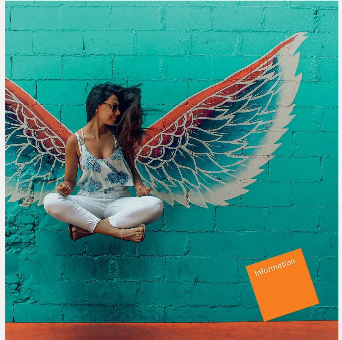
Foto: Flyer der Anlaufstelle