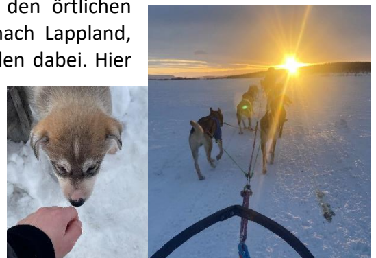
Huskytour in Kiruna, SWE, Februar 2022

Im Mai stand dann noch die Fahrt nach Norwegen an. Dort haben wir eine Fjordtour durch den UNESCO Nærøfjord, eine Gletscherwanderung unternommen. Eine wunderbare Unterkunft direkt an einem Fjord hatten wir ebenfalls. Als Gegenpol zu der vielen Natur haben wir auch den Städten Oslo und Bergen einen Besuch abgestattet.