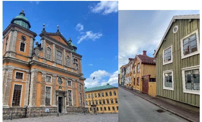
Kathedrale und Häuser in Kalmar, SWE, Juni 2022

Es war eine sehr schöne Zeit in Kalmar und ich bin froh, dass ich mich für ein Auslandssemester entschieden haben. Ich würde es jedem an Herz legen, der diese Möglichkeit hat, es auf jeden Fall zumachen. Man sammelt viele unvergessliche Momente, lernt neue tolle Menschen kennen und lebt einfach für ein halbes Jahr in einem anderen Land. Kalmar ist wirklich ein schönes Städtchen und hat von einer Altstadt mit vielen kleinen Häuschen und Gassen, Cafés, einem Wasserschloss bis hin zur Natur außerhalb, viel zu bieten.