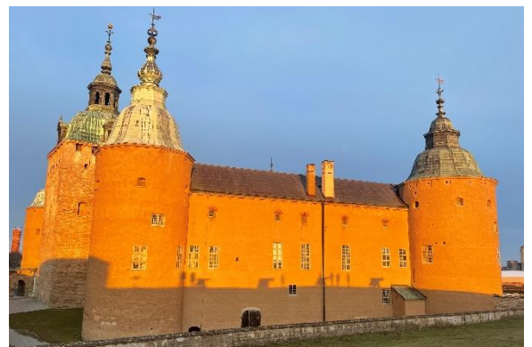
Wasserschloss in Kalmar, SWE, Januar 2022

Was ich besonders großartig fand, dass ich während meines Aufenthaltes in Kalmar, Zeit hatte um sehr viel zureisen. Zu den Trips nach Lappland und Norwegen kam noch Z.B. Finnland, Estland und Dänemark hinzu. Städtetrips nach Göteborg, Stockholm etc. und diversen Wochenendausflüge, haben die Zeit in Kalmar unvergesslich gemacht.