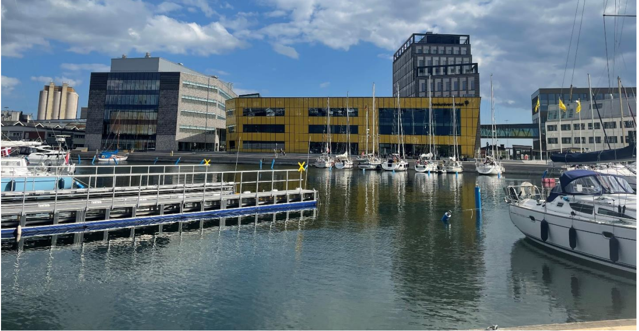
Linnéuniversität am Hafen, Juni 2022