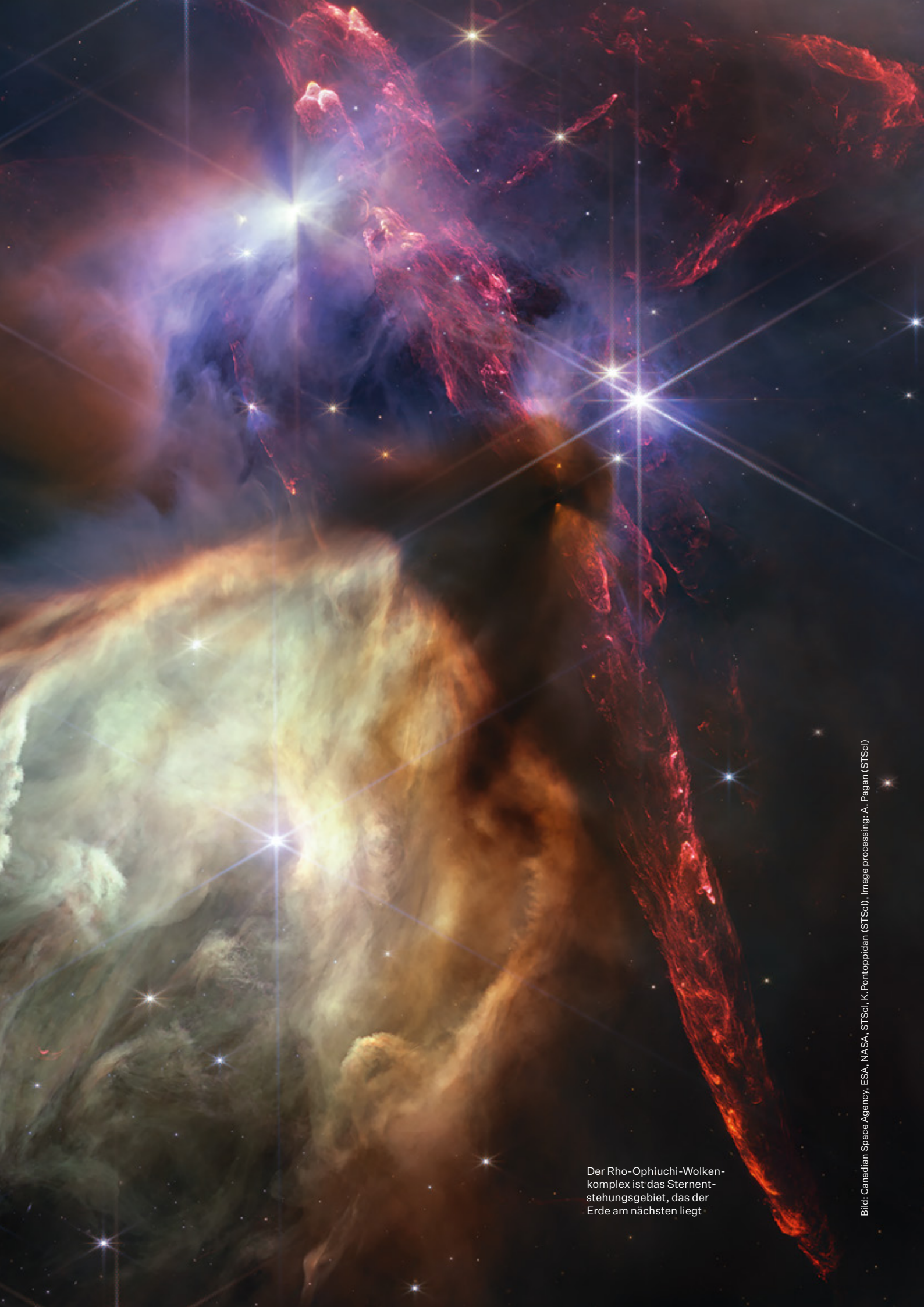
Der Rho-Ophiuchi-Wolkenkomplex ist das Sternentstehungsgebiet, das der Erde am nächsten liegt