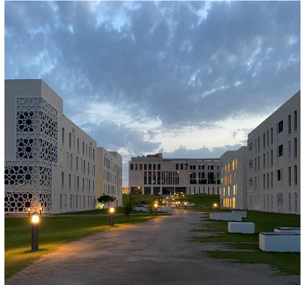
Abbildung: Accommodation auf dem Campus