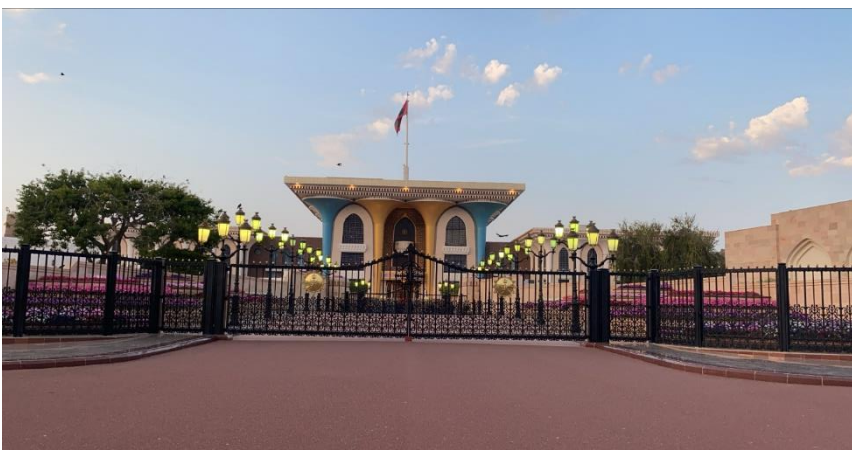
Abbildung: Sultan Qaboos Palast - Old Town Muscat