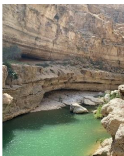
Abbildung 5: Wadi Shab

Souks: diese typischen Märkte sind für ihre Farben und Gerüche weltweit bekannt. Ich hatte die Möglichkeit, den Souk von Mutrah zu besuchen, bevor alle Geschäfte zugemacht wurden, und kann bestätigen, dass Souks ein absolutes Muss sind – vor allem für uns Mädels! Mein Tipp wäre es, Souks mit Einheimischen zu besuchen, um Abzocke und Touristen Falle zu vermeiden.