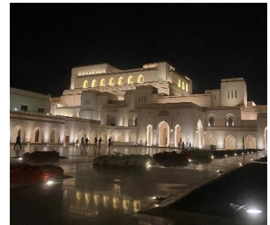
Abbildung 7: Opera House Maskat

Opera House: charakterisiert durch seine Vielfalt an Aufführungen und Shows und seine atemberaubende Architektur, das Opera House (Abbildung 7) war mit Abstand einer meiner Lieblingsorte in Maskat.