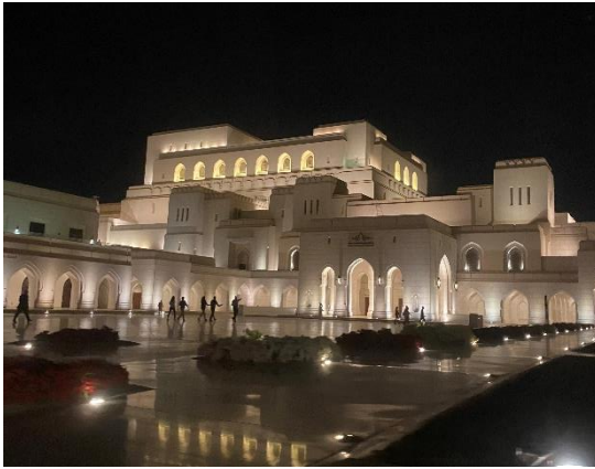
Abbildung: Operahouse Platz