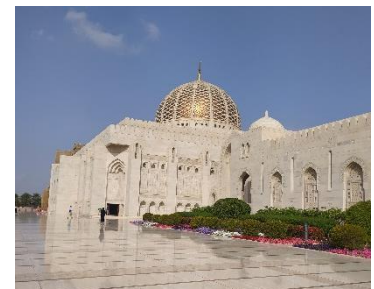
Abbildung 4: Grand Mosque

https://theculturetrip.com/middle-east/oman/articles/these-mosques-in-oman-are-an-architectural-wonder/