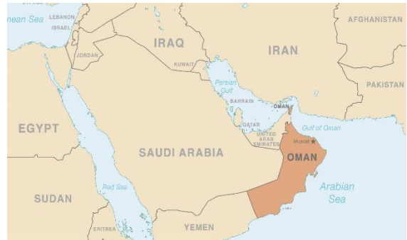
Abbildung 1: Naher Osten

Während des 5. Semesters von meinem Tourismus Management Bachelor-Studium an der Fakultät 14 der Hochschule München habe ich als Austauschstudent an der German University of Technology im Oman ( Abbildung 1 ) studiert.