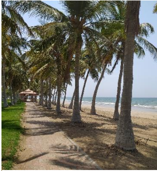
Abbildung 6: Al Qurum Beach

Strände: es gibt viele schöne Strände in Maskat, wo man spazieren gehen oder picknicken kann. Mein Lieblingsstrand in dieser Hinsicht ist Seeb Beach mit seinen Metzgereien and Fisch Markt. Wenn es zum Baden kommt, es muss dann klargestellt werden, dass Omani keine „Strand-Kultur“ haben und aus diesem Grund es wäre empfehlenswert an „Expats-beaches“ zu gehen, wie z.B. das Muscat Hill Resort (OMR 10,- Eintritt), Al Qurum Beach (Abbildung 6) oder Al Mouj – The Wave.