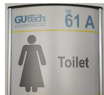
Abbildung 2: Toiletten-Schild in der Uni

!!! Vorwarnung: Auf dem Campus herrscht ein Dresscode und v.a. Frauen müssen angemessen angezogen sein, d.h. Oberarme, Beine bis über dem Knie, Dekolleté und Bauch müssen bedeckt sein. Unterwegs kann man generell tragen, was man will; es ist trotzdem empfehlenswert, sich für etwas nicht