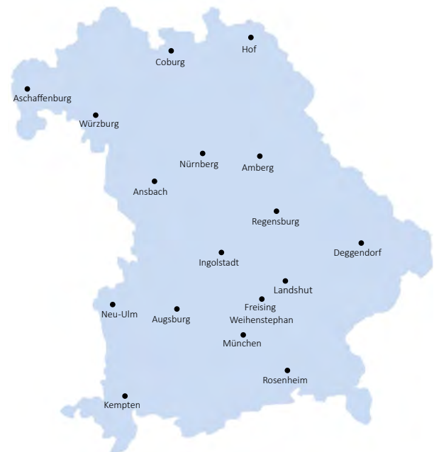
Standorte der 17 bayerischen staatlichen Hochschulen für angewandte Wissenschaften (HAW)

Sie achten auf die Vermeidung von Nachteilen für Wissenschaftlerinnen, weibliche Lehrpersonen und Studierende, unterstützen die Hochschule in der Durchsetzung der Gleichberechtigung von Frauen und Männern und wirken auf die Beseitigung bestehender Nachteile hin.